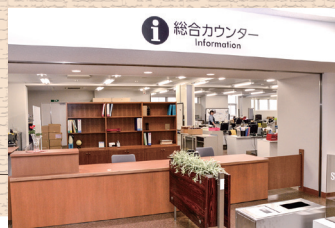
中央図書館総合カウンター