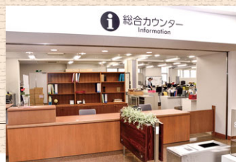
中央図書館総合カウンター