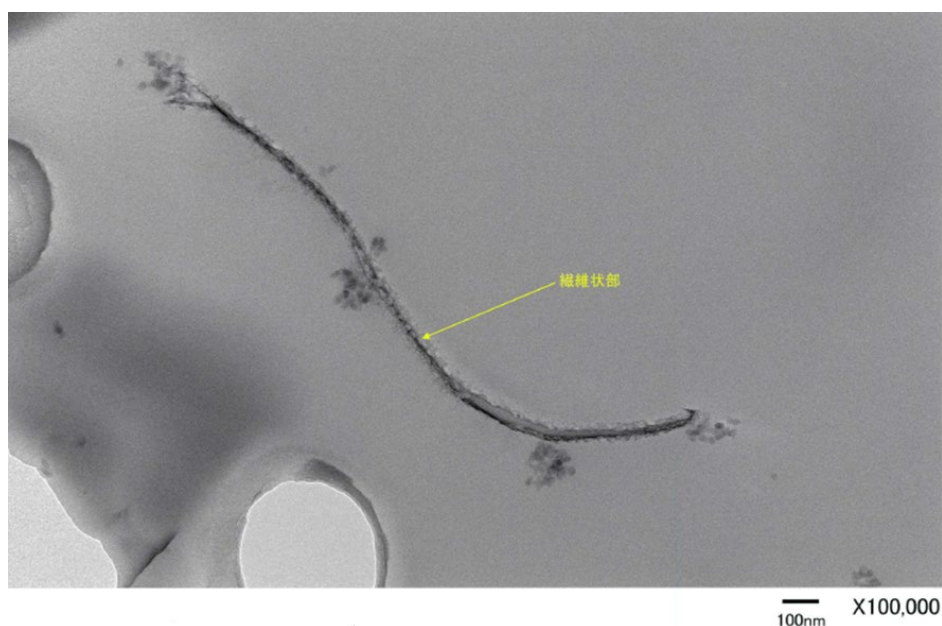
図 2 .エポキシ樹脂中で観察された CNF

この CNF は、CFRP を作成する際に樹脂と共に炭素繊維の隙間に入り込んで存在し、ネットワークを形成することで、外力からの破壊進展を妨げる干渉材の役割を果たすものと推察されます。CFRP は炭素繊維とマトリックス樹脂との間に界面が存在するので、衝撃を受けた時に界面剥離 ※4 が破壊起点となります。今回利用した CNF がマトリックス樹脂内に均質に分散し、CNF に付与された官能基がエポキシ樹脂と炭素繊維の間の強度を高めることに貢献し、界面剥離を抑制していると考えられます。このことは CFRP 破壊後の走査型電子顕微鏡（SEM）観察により、炭素繊維表面上に付着する樹脂の様相にて、CNF 添加仕様のもものが多く残存していることで確認できました。（図 3 参照）