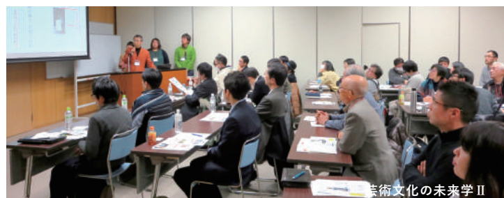
芸術文化の未来学 II