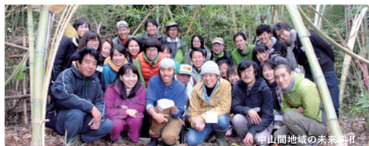
中山間地域の未来学 II

バス | JR 松本駅「お城口(東口)」を出て右前方「アリオ」1 階、松本バスターミナルのりば 1「信大横田循環線」または「浅間線」に乗りし約 15 分、バス停「信州大学前」下車して(200 円)、進行方向右斜め道路向かいに大学正門があります。会場の経済学部方面へは、次のバス停「大学西門」下車が便利です。