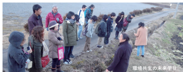
環境共生の未来学 II