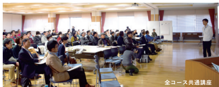
全コース共通講座