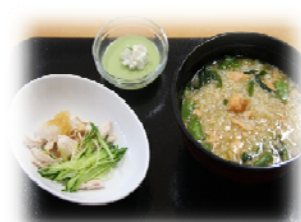
300円メニュー （子ども普通量のハーフサイズ）