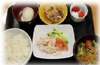
500円メニュー （子ども普通量）