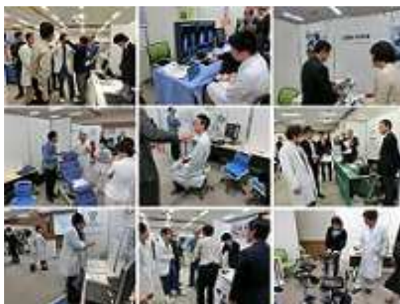
昨年度の技術シーズ展示会の様子

信州メディカル産業振興会 事務局 (信州大学 学術研究・産学官連携推進機構) 電話 0263-37-3421 FAX 0263-37-3425 E-mail : smia@shinshu-u.ac.jp