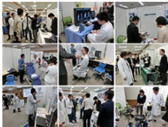
昨年度の技術シーズ展示会の様子

信州メディカル産業振興会 事務局 (信州大学 学術研究・産学官連携推進機構) 電話 0263-37-3421 FAX 0263-37-3425 E-mail : smia@shinshu-u.ac.jp