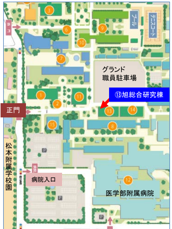
松本キャンパスマップ