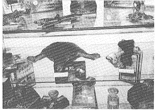
図2 漢方材料展示室