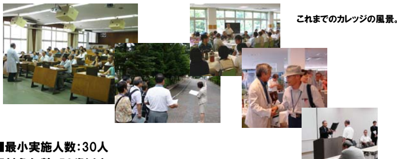
これまでのカレッジの風景。