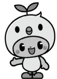
エコチル信州シンボルキャラクター「エコぴよ」