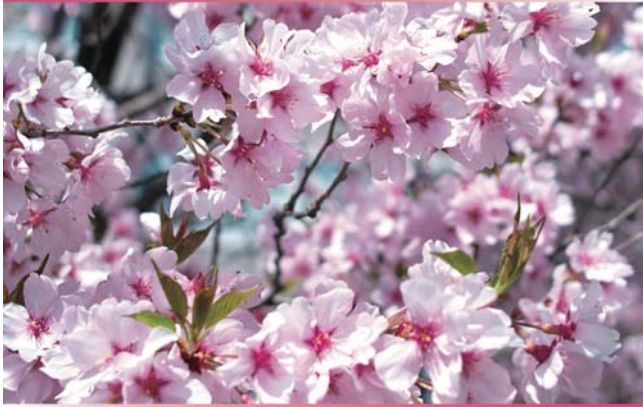
一年中、咲かせて欲しい“さくら”がある。