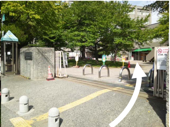
信州大学西門付近 (門を入れて左にお進みください)