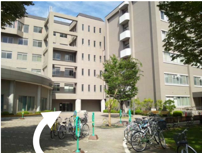
会場(人文・経済学部 新棟) 入口