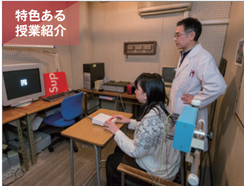
特色ある授業紹介

平成29年度からカリキュラムを発展させ、人文学部の多彩な科目を幅広く履修し横断的な理解を促進する広域履修プログラム、自らの専門分野に立脚しながら現代社会の課題に取り組む科目「人文学総合ワークショップ」を開設しました。