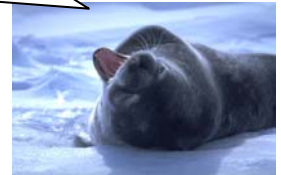
アザラシの赤ちゃん

プレゼント抽選会! : 南極観測に関する質問をEmailで送ってください(学校名、学年、氏名を忘れずに)。