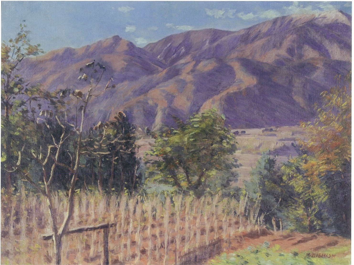
小林万吾《山辺》制作年不詳 信州大学附属図書館蔵