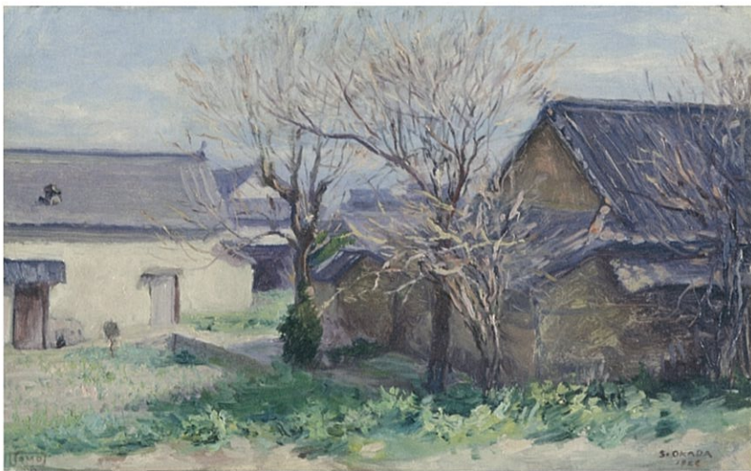
岡田三郎助《信濃の春》1922年 信州大学附属図書館蔵