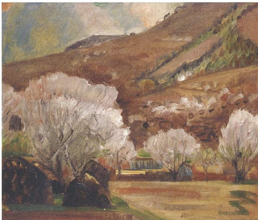
藤島武二《杏花》1933年 長野県信濃美術館蔵