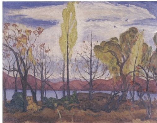
滝谷国四郎《晩秋、野尻湖畔》1923年 信州大学附属図書館蔵