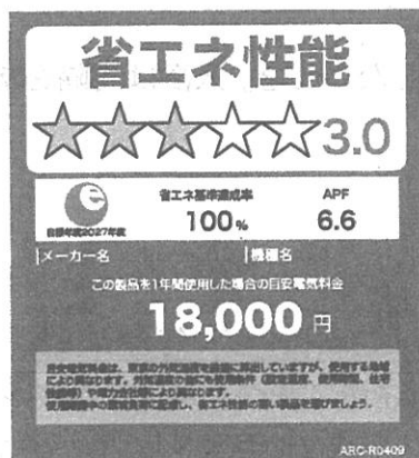
(家庭用エアコンディショナーのイメージ)