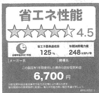
(冷蔵庫のイメージ)