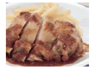
チキンおろしだれ 不動の一番人気。食べごたえあり！