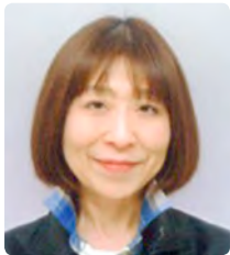
男女共同参画 推進センター長 (学術研究院保健学系教授 /学長補佐)